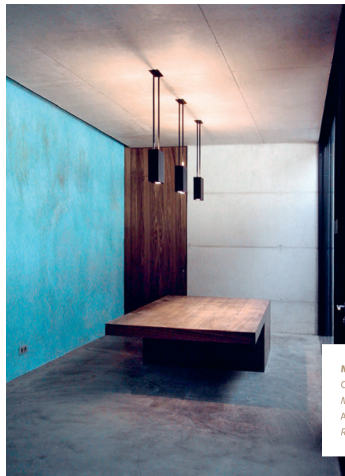
Manincor – Reception Concetto cromatico: M. A. Mayr Architettura: W. Angonese, R. Köberl, S. Boday