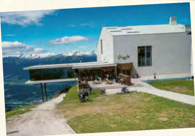
Un'incursione nel mondo della fotografia di montagna presso il Lumen, seguita da un pranzo all'Alpin per raggiungere l'apice dell'esperienza culinaria.