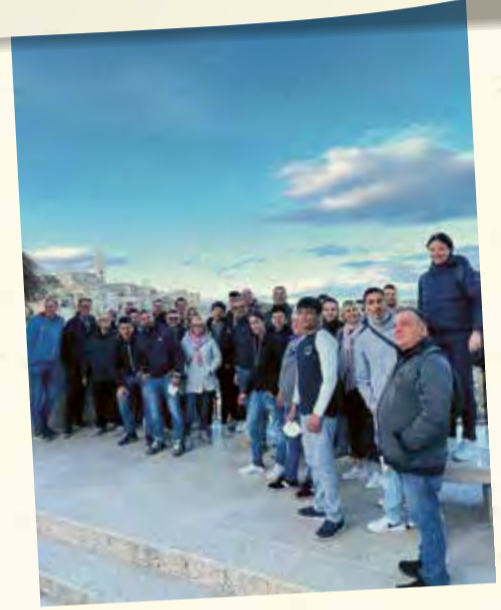
...e nella ricchezza culturale di Matera, Capitale della Cultura 2019.

Ogni grande anniversario merita una grande festa! Dopotutto, sessant'anni di successi sono un traguardo importante, da celebrare a dovere, tutti insieme. E quale cornice migliore per festeggiare se non le mete da sogno che offre il Sud Italia?