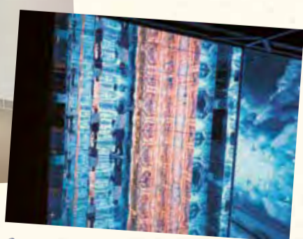
Un approccio artistico-poetico al mondo della montagna: realtà e illusioni ottiche si fondono in un'esplosione di colori.

Volete ricevere maggiori informazioni sul nostro nuovo centro di formazione e sulle opportunità di formazione e aggiornamento che offriamo?