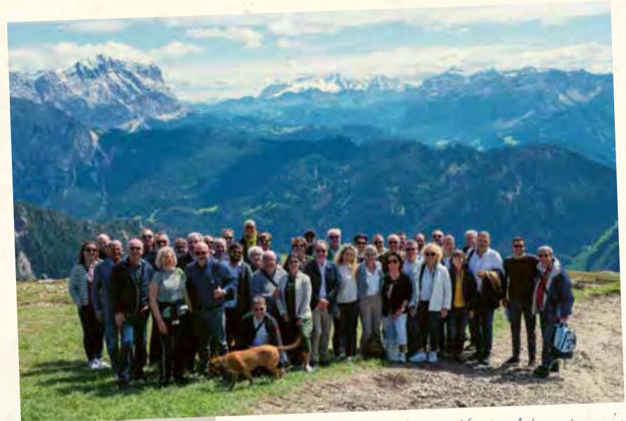
Un'azienda con una visione: Nordwal durante un incontro con i partner aziendali davanti alle Dolomiti della Val Badia.