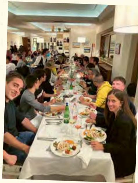
Un'immersione nella tradizione enogastronomica pugliese...