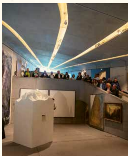
Al Messner Mountain Museum a Plan de Corones