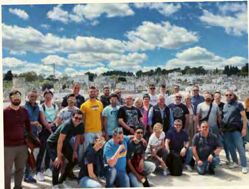
I suoi Trulli in pietra calcarea l'hanno resa celebre: nel 1996 Alberobello è stata dichiarata Patrimonio dell'Umanità dall'Unesco.