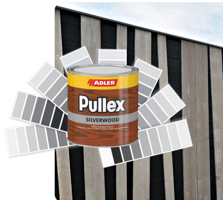
Foto: Dettaglio di una facciata

La patina grigia omogenea non è solo senza tempo, ma è anche versatile: dal legno vecchio rustico al moderno effetto Metallic con Pullex Platin, puoi scegliere la tonalità di grigio adatta alle tue esigenze.